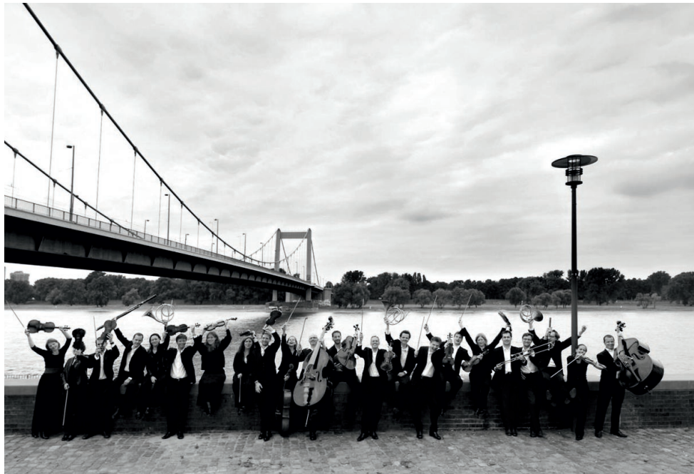
Das Neue Orchester