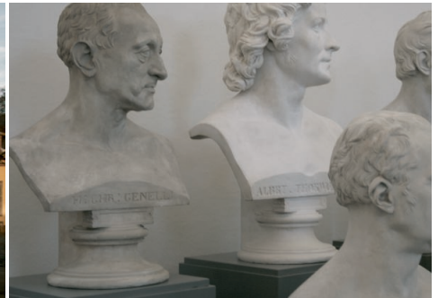
Residenzschloss Arolsen, Schlossgarten, Steinerner Saal, Büsten im C.D. Rauch-Museum