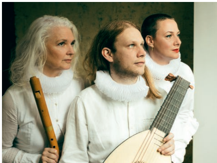
Semperviva, Ensemble Interchange (oben)